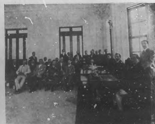
SANTA CLARA.—Asamblea Senatorial.