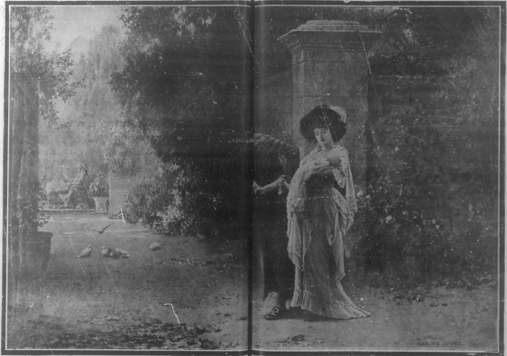
MATRIMONIO P... de Marcus Stone.