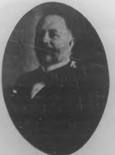
General Francisco Carrillo Gobernador de las Villas