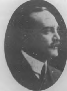
Coronel Bernabé S. Batista Gobernador de Camagüey

Los jóvenes de la acera solicitaron de la "Tuna Jovellana" comparsa artística formada por estudiantes gijoneses recién llegada de España en excursión artística, que toma parte en la fiesta para darle mayor animación. Y a ello accedió gustosa la "Tuna" muy satisfecha de poder ofrecer un acto de simpatía a una autoridad cubana, ejecutando el Himno Nacional y alguna otra composición, y mereciendo muchos aplausos y el reconocimiento de todos. Los trajes de estudiante de los de la "Tuna Jovellana" hacían más pintoresco el aspecto del "Círculo" y sus alrededores atestados de público entusiasmado.