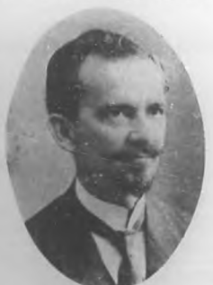
Coronel Indalecio Sobrado Gobernador de Vuelta Abajo