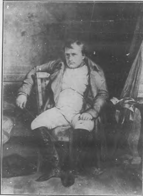
"La Noche de Fontainebleau." Napoleón I antes de abdicar.—Cuadro del Museo de Versalles.