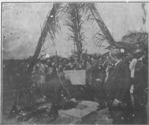
SANTA CLARA. Colocación de la primera piedra del edificio para Instituto.

Varias notes de Santa Clara ofrecemos en esta página. Una