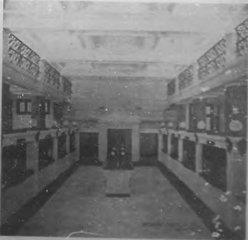
UNA VISTA INTERIOR