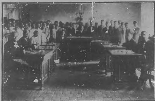
CAMAGUEY.—Toma de posesión del nuevo Gobernador.