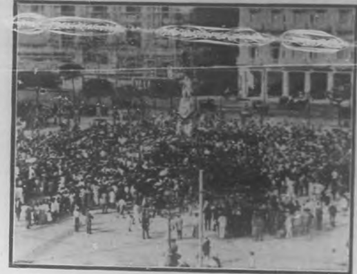
Los "Emigrados Revolucionarios" depositando flores al pie de la estatua de Martí el día 24 de Febrero.