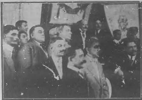
El general Asbert al tomar posesión del gobierno civil de la Habana.

Del acto de la toma de posesión del Gobierno de la Provincia, por el general Asbert da una idea aproximada la adjunta fotografía. En ella aparece el gobernador, rodeado de numerosos amigos políticos durante la ceremonia que resultó todo lo entusiasta del caso tratándose, como se trata, de una personalidad popular y querida como lo es el general Asbert.