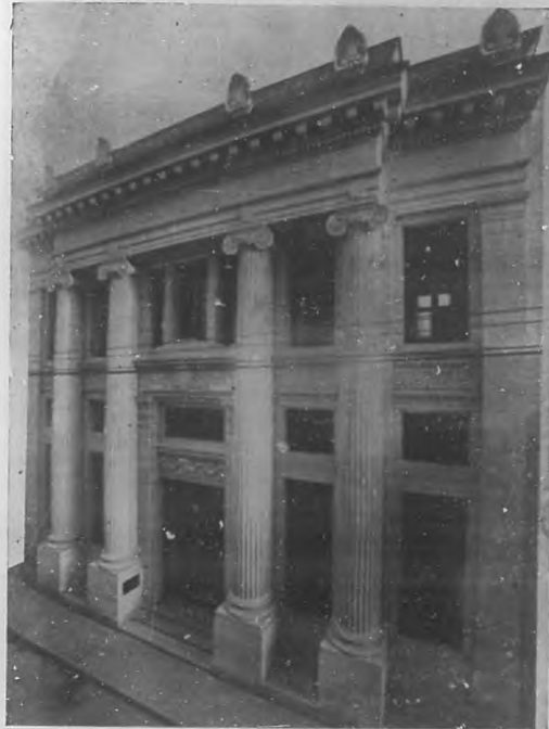
VISTA EXTERIOR DE THE TRUST CO. OF CUBA.