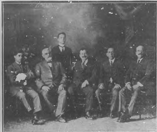
SANTA CLARA.—Los Secretarios de O. Públicas, de Instrucción Pública y Bellas Artes, y otras personalidades que asistieron al acto.

En el grupo fotográfico que á continuación publicamos figuran distinguidas personalidades que asistieron a la colocación