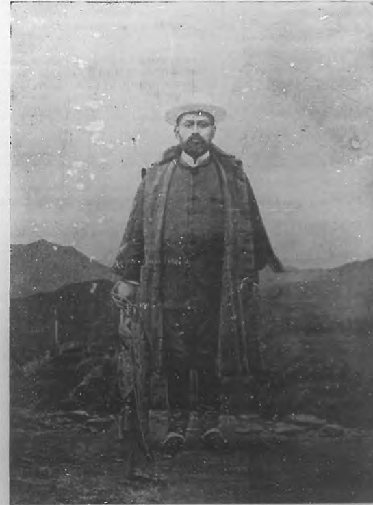
GENERAL CIPRIANO CASTRO.

Le deseamos que el recuerdo de su estancia en Cuba le sea grato, y que siempre vea en cuantos actos en honor suyo se hayan organizado el espíritu de solidaridad que une á los pueblos latino-americanos.