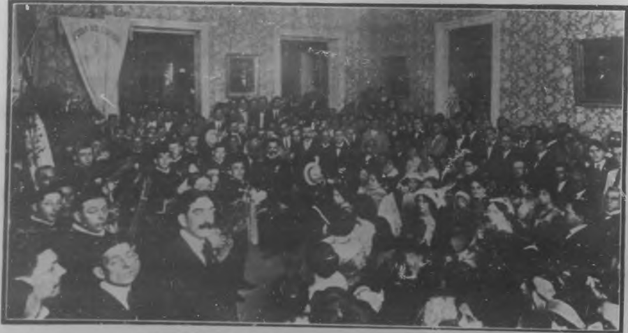
La "Tuna Jovellana" en la fiesta al general Asbert en el Círculo del paseo Martí.

nos", comparsa artística formada por estudiantes gijoneses recién llegada de España en excursión artística, que toma parte en la fiesta para darle mayor animación. Y a ello accedió gustosa la "Tuna" muy satisfecha de poder ofrecer un acto de simpatía a una autoridad cubana, ejecutando el Himno Nacional y alguna otra composición, y mereciendo muchos aplausos y el reconocimiento de todos. Los trajes de estudiante de los de la "Tuna Jovellana" hacían más pintoresco el aspecto del "Círculo" y sus alrededores atestados de público entusiasmado.