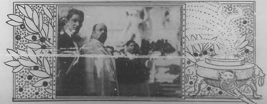
El General Cipriano Castro pronunciando un discurso ante la estatua del Apóstol Martí.